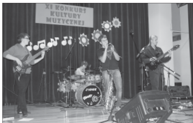
Uczestnicy XI Międzypowiatowego Konkursu Kultury Muzycznej