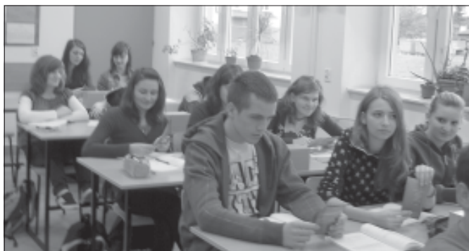
Promocja projektu „Wiedza kluczem do sukcesu”.

udział w zajęciach poszerzających wiedzę z matematyki uczestniczyła w zajęciach na Politechnice Rzeszowskiej Wydział Matematyki i Fizyki Stosowanej z matematyki. 24.11.2010r. młodzież biorąca udział w projekcie uczestniczyła w zajęciach z matematyki na Politechnice Rzeszowskiej w ramach projektu „Wiedza kluczem do sukcesu”. Temat zajęć: Liczby Fibonacciego i złota liczba w matematyce i w naturze. 6.11.2010r. i 19.11.2010r. odbyły się wyjazdy na