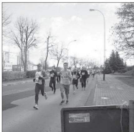
Po biegu na dystansie 7 km (0:29:54).

Tradycyjnie 11 listopada ulicami Krośna odbył się Bieg Niepodległości. To już XIV edycja biegu. Pobiec mógł każdy kto cieszył się dobrym zdrowiem i miał ukończone 12 lat. Uczestnicy mieli do pokonania dystans 7 kilometrów. Wystartowali spod pomnika Józefa Piłsudskiego na rynku o godz. 11.00 i zmierzali do mety przy Hali Sportowo-Widowskiej. Rów-