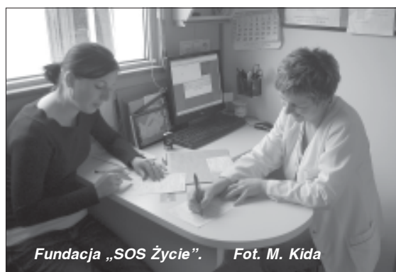
Fundacja „SOS Życie”.