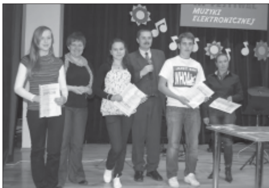
Laureaci – II Międzypowiatowy Festiwal Muzyki Elektronicznej.