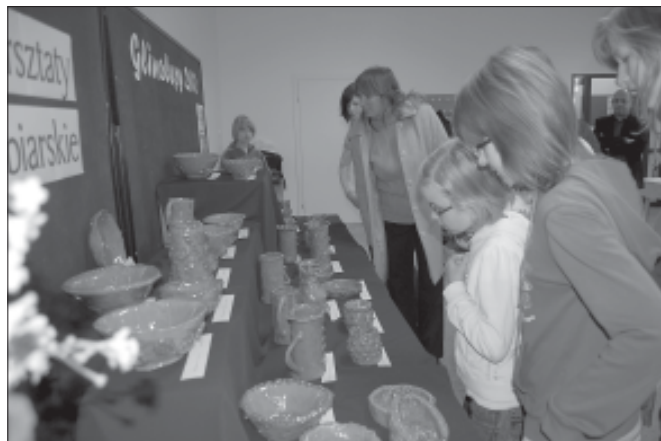
Wystawa cieszyła się dużym zainteresowaniem...