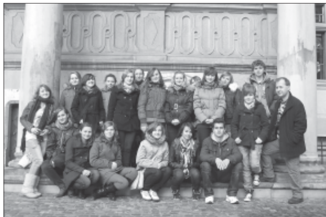
Młodzież podczas wycieczki do Krakowa.