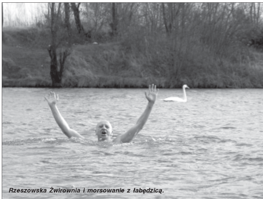
Rzeszowska Żwirownia i morsowanie z łabędzią.