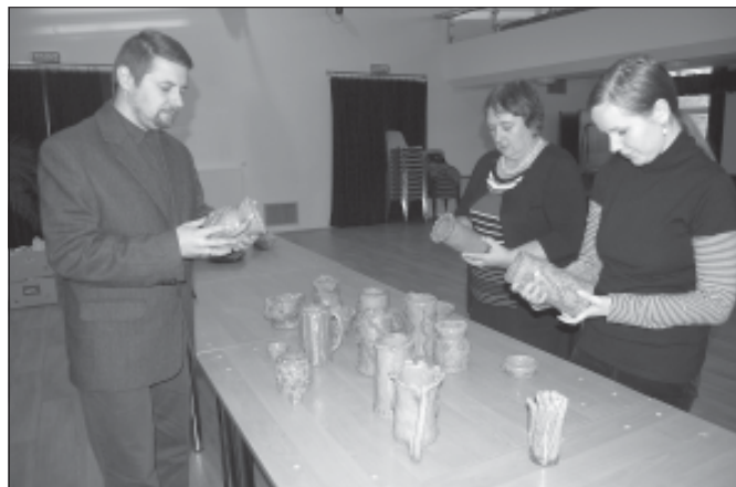
Komisja Artystyczna przy pracy...