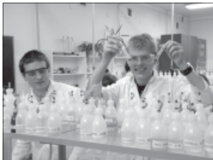
Młodzież podczas zajęć z chemii – Pokazy Naukowe na Politechnice Rzeszowskiej.

– Zadanie 7 Zajęcia z doradztwa zawodowego 15.11.2010 r. i 22.11.2010 r. odbyły się zajęcia grupowe z doradcą zawodowym zorganizowane dla młodzieży biorącej udział w projekcie. Młodzież biorąca udział w projekcie może skorzystać z zajęć indywidualnych z doradcą zawodowym (harmonogram na stronie projektu).