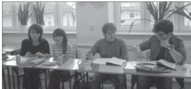
Młodzież otrzymała materiały edukacyjne i biurowe w ramach projektu.

kacyjna do Krakowa. Uczestniczyło w niej 45 uczniów. Program wycieczki obejmował lekcje muzealne, zwiedzanie zabytków i muzeów. Młodzież podczas wycieczki zwiedzała następujące miejsca: Kraków – Komnaty na Wawelu, Skarbiec i Zbrojownia, Dzwon Zygmunta, Katedra, Groby Królewskie, Bazylika Mariacka, Muzeum Uniwersytetu Jagiellońskiego