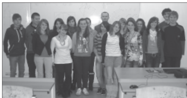
Młodzież podczas zajęć z matematyki – Pokazy Naukowe na Politechnice Rzeszowskiej.

– Zadanie 6 Zajęcia psychologiczno-pedagogiczne. Zatrudniony psycholog i pedagog prowadzi zajęcia psycholo-