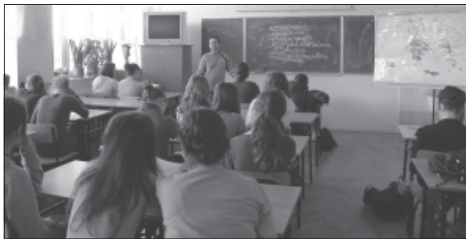
Zajęcia grupowe z doradztwa zawodowego.

– Zadanie 8 Zajęcia pozaszkolne – Pokazy naukowe. 17.11.2010r. w ramach projektu „Wiedza kluczem do sukcesu” współfinansowanego ze środków Unii Europejskiej w ramach Europejskiego Funduszu Społecznego Priorytet IX, Działanie 9.1., Poddziałanie 9.1.2. młodzież z koła fizycznego i biorąca