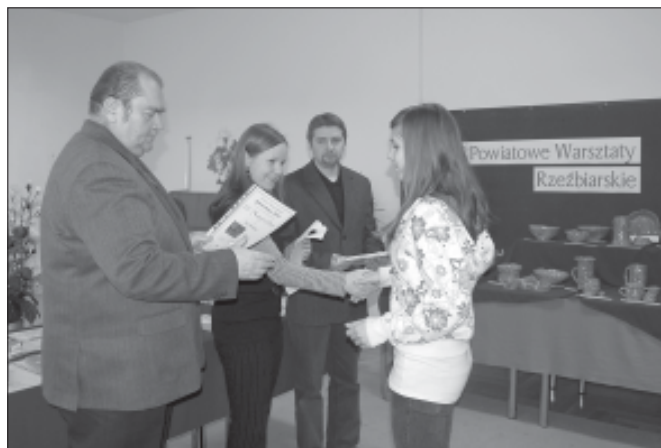
Wręczenie nagród i dyplomów.