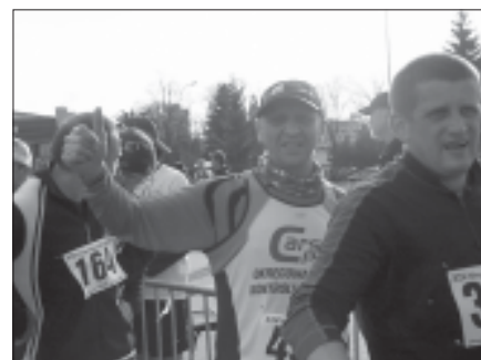
XIV Bieg Niepodległości w Krośnie.