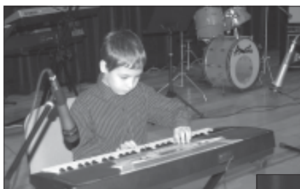
Uczestnicy II Międzypowiatowego Festiwalu Muzyki Elektronicznej.